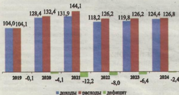
Рисунок 1. Основные показатели бюджета Саратовской области, млрд рублей

В 2022-2024 годах планируется дефицит областного бюджета, который к 2024 году снизится более чем в пять раз по сравнению с текущим