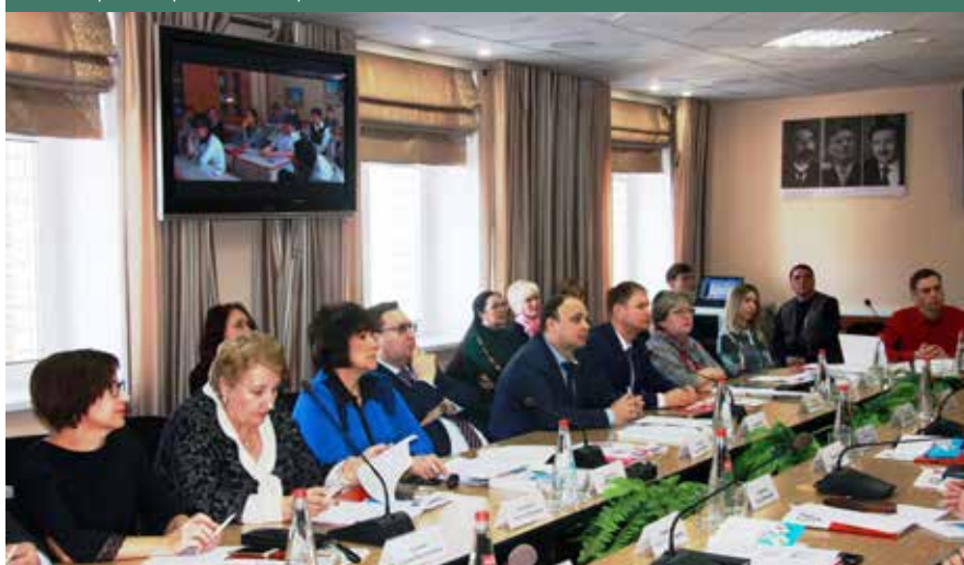
Круглый стол «Повышение бюджетной грамотности населения Саратовской области: итоги реализации и стратегия развития», апрель 2018 г.

области мониторинга общественного мнения и фокус-групповых исследований. В связи с этим необходимо с помощью специальных образовательных программ повышать осведомленность граждан в вопросах бюджетного процесса. Особенно это важно для молодежи: бюджетная грамотность, заложенная в умы подрастающего поколения сегодня, — колоссальный шаг к прозрачному управлению и понятной политике завтра.