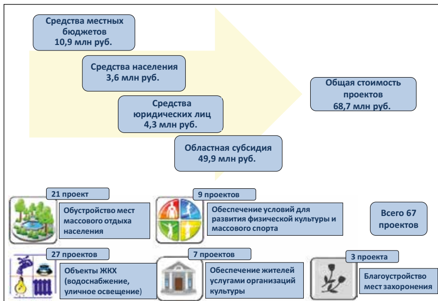
Рисунок 2. Проект поддержки инициатив местного населения — 2018

В целях обеспечения общественной оценки деятельности государственного органа и принимаемых им решений создан Общественный совет при Министерстве финансов области. Вопросы, обсуждаемые на заседании совета, затрагивают ключевые направления реализации бюджетной политики региона, условия формирования и параметры областного бюджета, а также планируемые результаты использования бюджетных средств. Мнение экспертного сообщества учитывается министерством при подготовке бюджетных решений. Для освещения деятельности Общественного совета создан одноименный раздел на официальном сайте Министерства финансов области и на портале «Открытый бюджет Саратовской области».