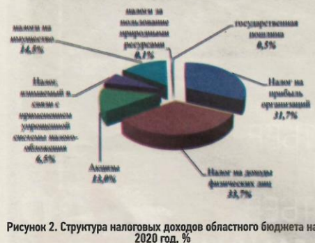
Рисунок 2. Структура налоговых доходов областного бюджета на 2020 год, %

Главными бюджетобразующими налогами для области являются налог на прибыль организаций и налог на доходы физических лиц, составляющие в сумме 65,4% налоговых доходов бюджета на 2020 год (рис. 2).