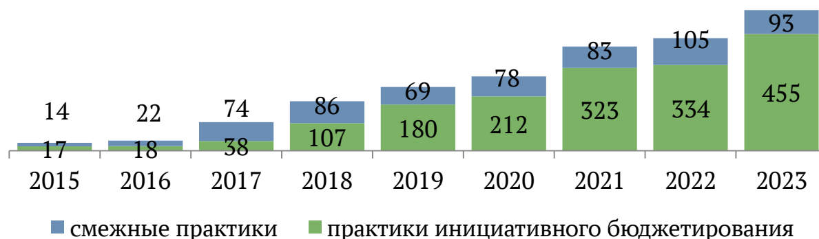
Рисунок 1. Динамика количества практик инициативного бюджетирования в России, единиц 1

За десять лет в нашей стране реализовано более 200 тысяч инициативных проектов, направленных на благоустройство территорий, ремонт дорог, установку уличного освещения, возведение детских и спортивных площадок. При этом общая стоимость реализованных проектов из года в год увеличивается: в 2023 г. она достигла 58,5 млрд рублей, что почти в 25 раз больше показателя 2015 года (рисунок 2). Всего за это время на реализацию инициативных проектов было потрачено более 240 млрд рублей.