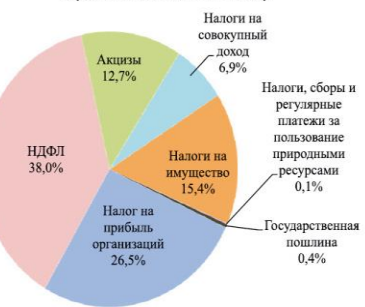
Рисунок 1. Структура налоговых доходов областного бюджета Саратовской области в 2020 году 1

Причем надо отметить, что такая ситуация сохраняется на протяжении ряда лет. Наблюдается устойчивая тенденция роста доходов бюджета Саратовской области, и доходы от поступлений НДФЛ растут пропорционально и продолжают занимать устойчивые лидирующие позиции (рисунок 2).