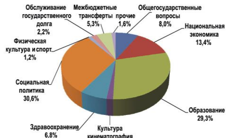
Рисунок 2. Структура областного бюджета по разделам классификации расходов бюджетов на 2022 год, %

Наибольшее внимание будет уделено мерам социальной поддержки и направлениям, обозначенным в указах Президента России и нацеленным на повышение благосостояния граждан.