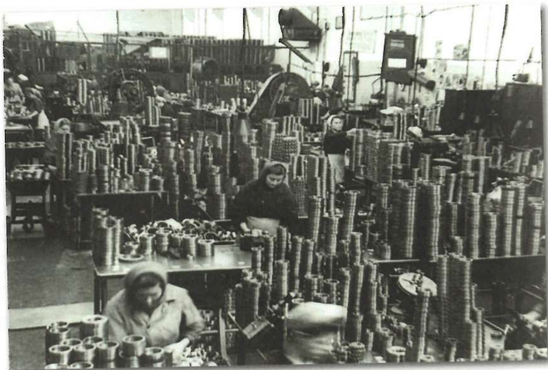
В цехе подшипникового завода

(№ 416). В дни Курской битвы нацисты хотели отрезать этот источник горючего от фронта. За семь ночей июня 1943 года на крекинг-завод было сброшено более 500 фугасных бомб и свыше 7 200 зажигательных. Были разрушены многие цеха, повреждены нефтехранилища. После бомбардировок на восстановление предприятия выходили все работники. В очень сложных условиях завод продолжал работать и поставлял топливо на фронт. В те дни план был выполнен на 151%.