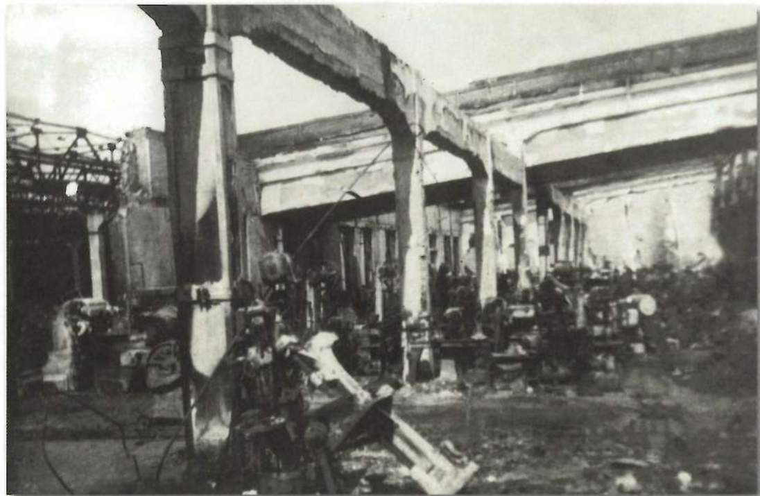
Цех авиазавода после бомбежки

Уже с октября 1941 года план по выпуску снарядов ежемесячно выполняли на 118%. С 1 января 1942 года завод был переименован в Саратовский механический завод. Помимо фронтowych заказов, по решению ГКО стал выпускать за-